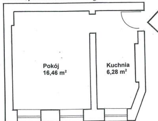
ul. Mieczysława Niedziałkowskiego 15/25