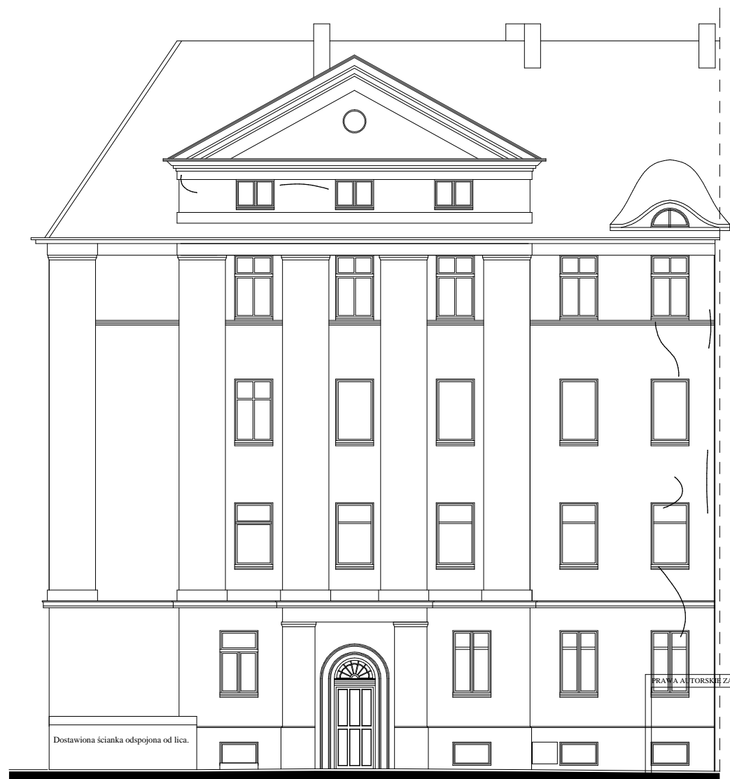
ELEWACJA AL. BOHATERÓW WARSZAWY 120

WIDOCZNE NAPRAWY I USZKODZENIA MUROWE. PROJEKTOWANA NAPRAWA WSKAZANA PRZYKŁADOWO W OPISIE