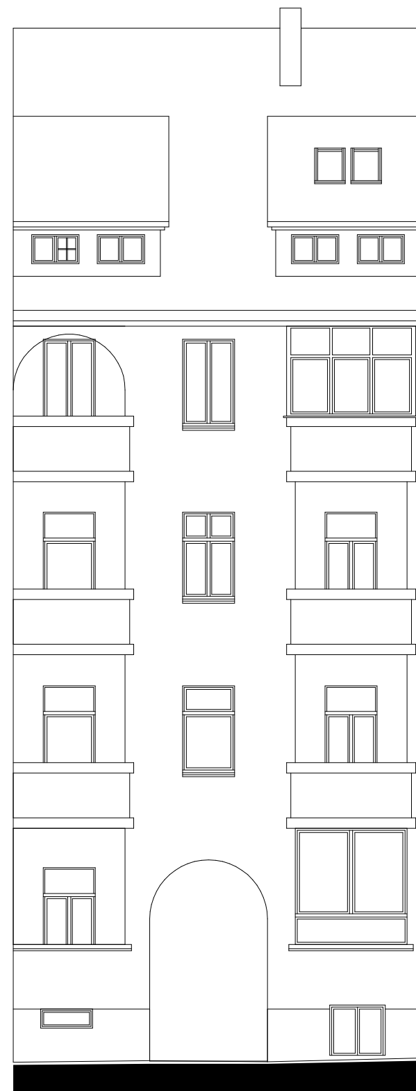
ELEWACJA NAROŻNA- TYŁ