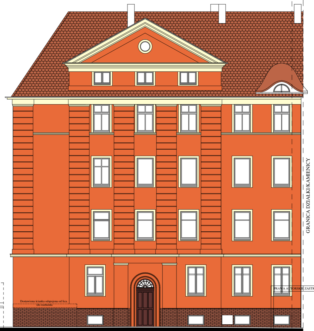
ELEWACJA AL. BOHATERÓW WARSZAWY 120