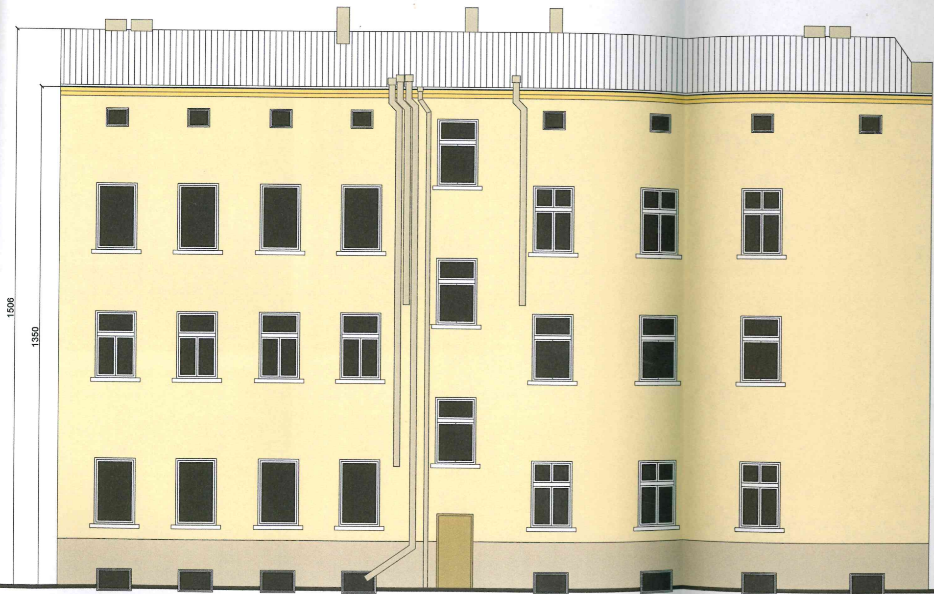
ELEWACJA TYLNA - PÓŁNOCNO-ZACHODNIA