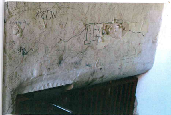
fol.1 nadproże nad wejściem do klatki schodowej