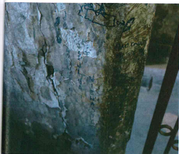
fol.2 ściana przy wejściu do klatki schodowej

kotwy Hilti HAS- M14x190 wklejane na żywicę epoksydową HVU