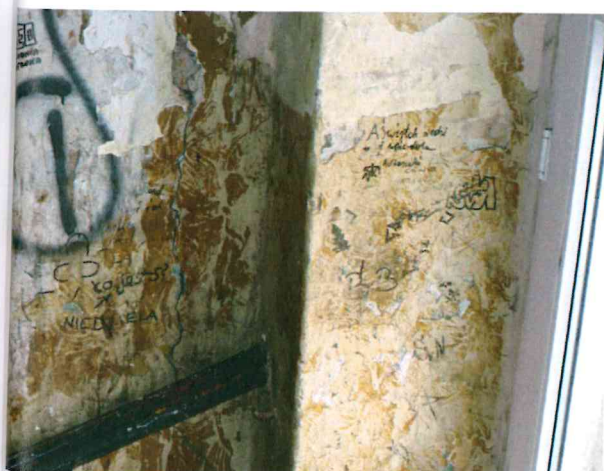
3 ściana przy połączeniu ściany klatki schodowej i ściany zewn.