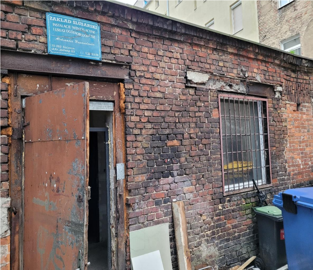
ul. bł. Kr. Jadwigi 23A oficyna