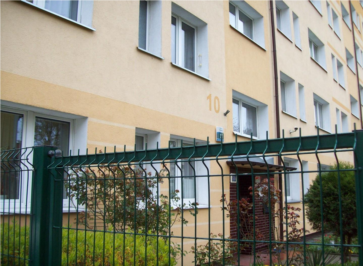
ul. Bazarowa/Matejki 10