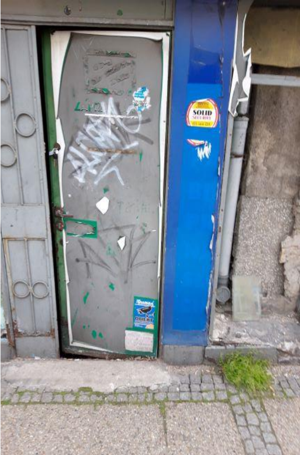
al. Wyzwolenia 82/U1