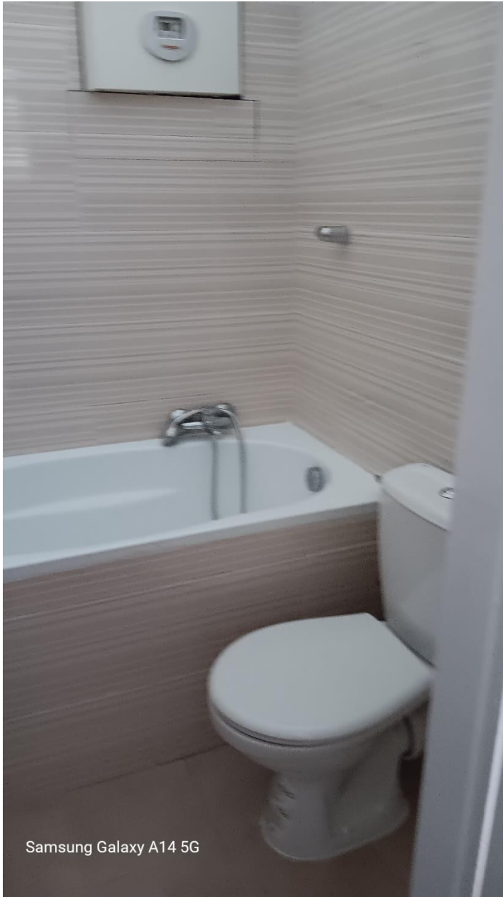
Samsung Galaxy A14 5G