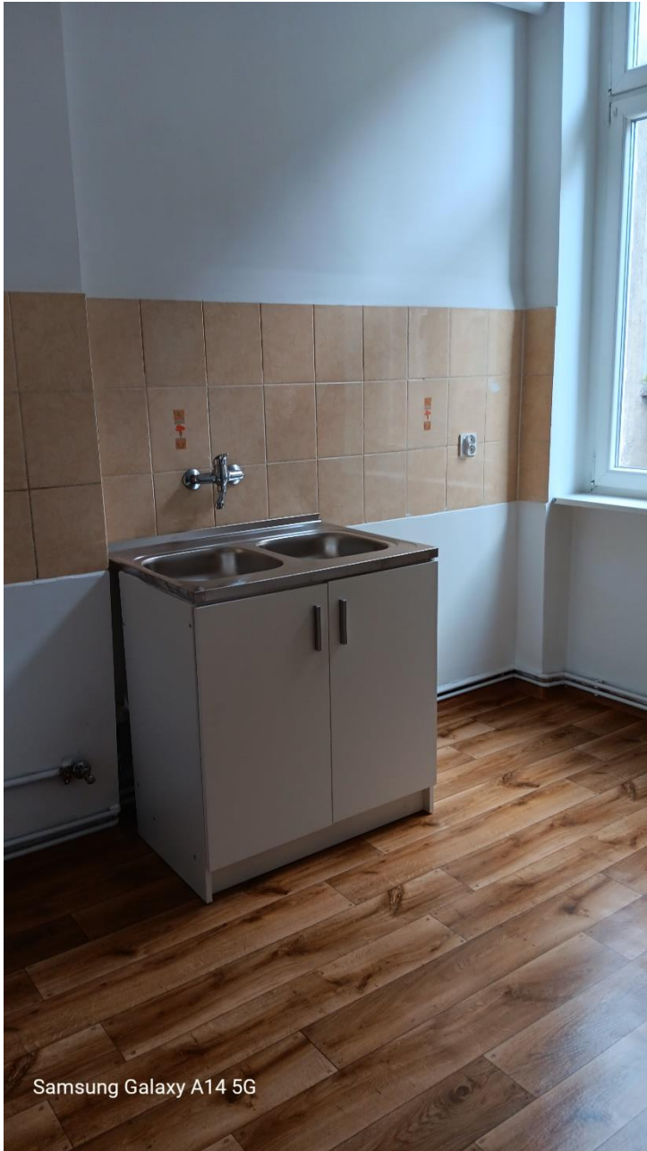
Samsung Galaxy A14 5G