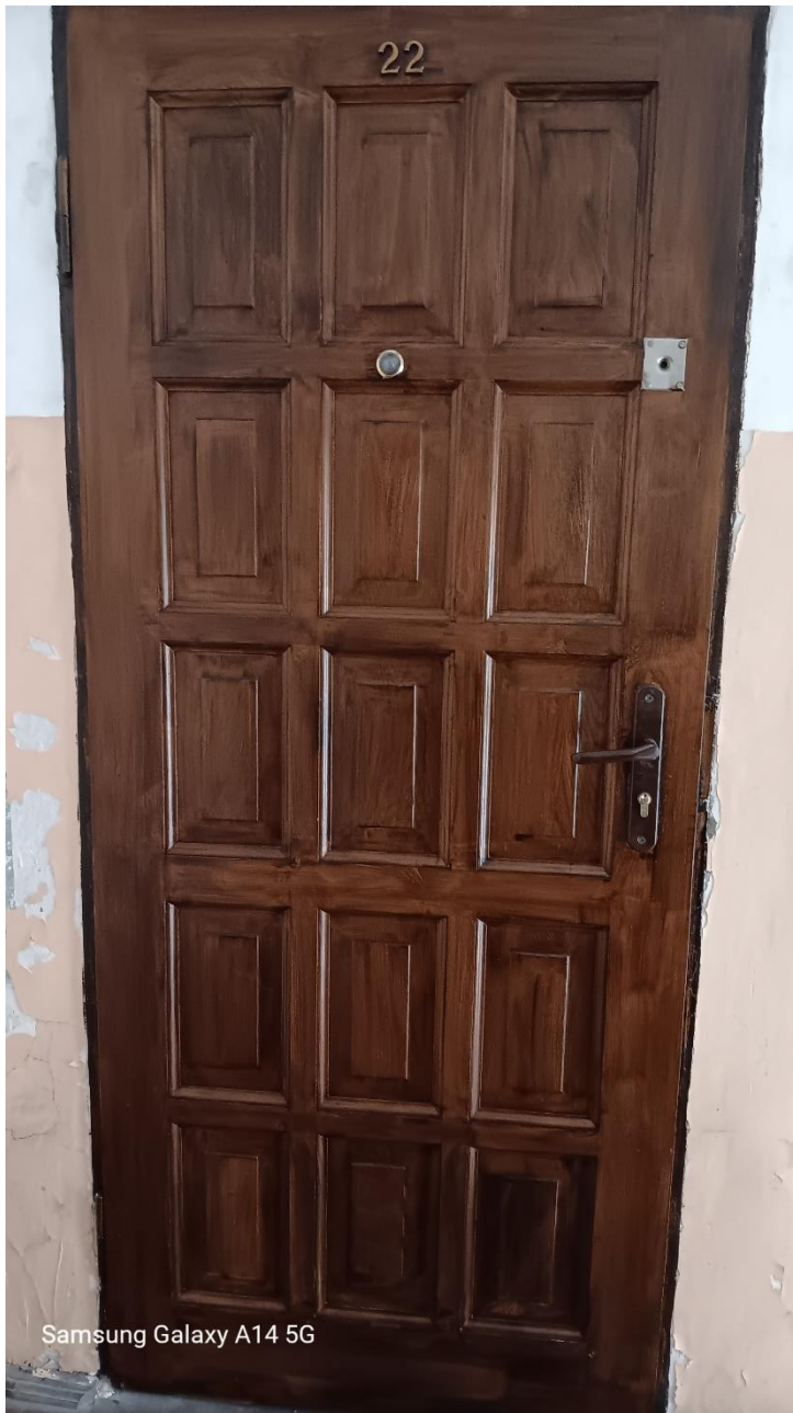
Samsung Galaxy A14 5G